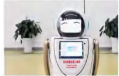
智能医用消毒机器人