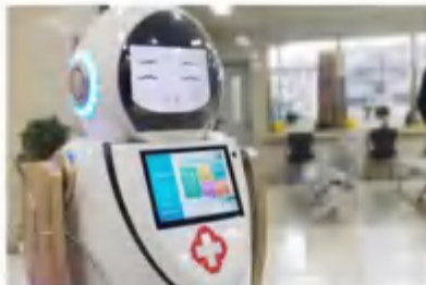
全自动智能消毒杀菌机器人