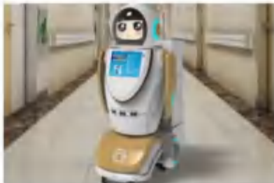
多功能消毒机器人