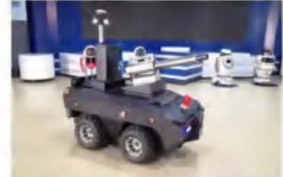
室外智能消毒机器人